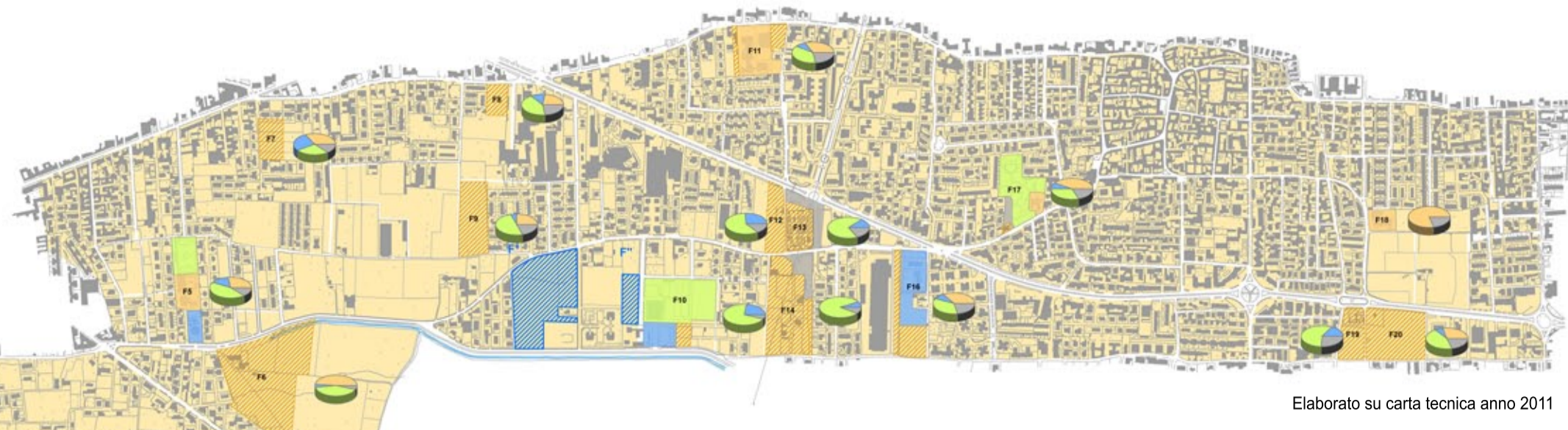
Elaborato su carta tecnica anno 2011