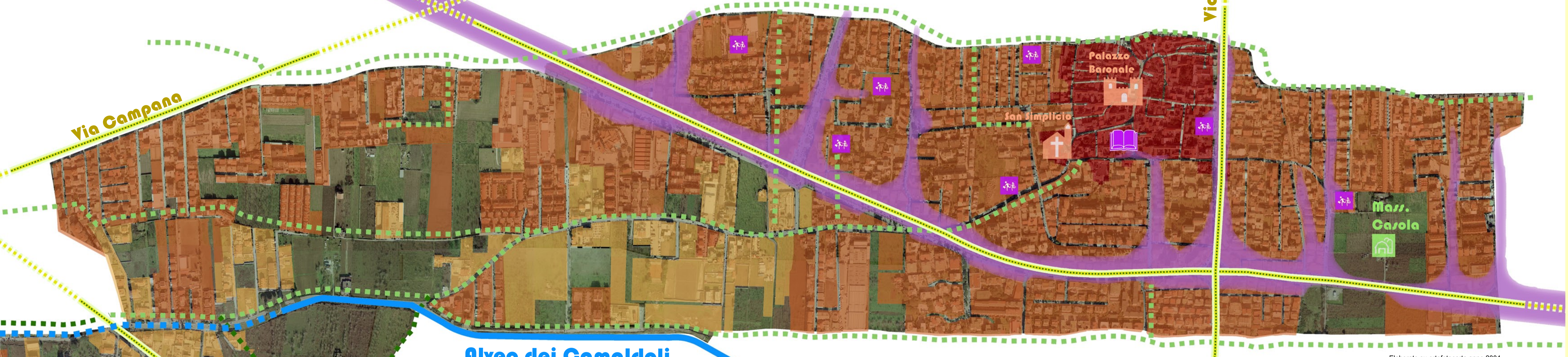
Elaborato su ortofotocarta anno 2004