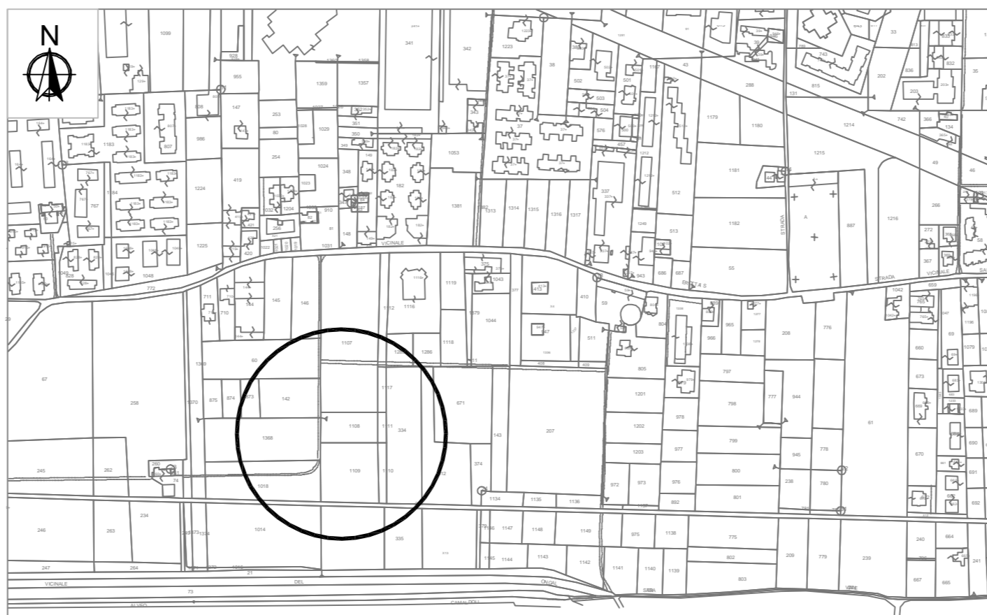
STRALCIO CATASTALE - scala 1:5000 Comune di Villaricca - Foglio 2 - part.IIa 1107-1108-1109