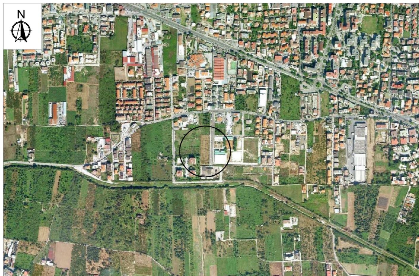
ORTOFOTO - scala 1:10.000