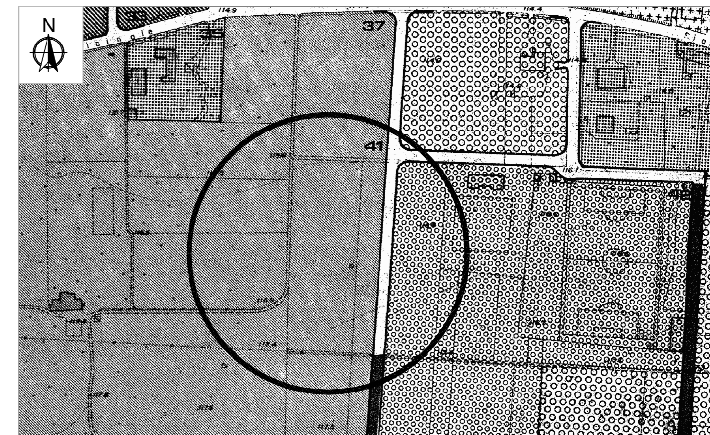
STRALCIO P.R.G. - scala 1:2500 Zona "C - Zona di nuova edilizia Economica e Popolare"